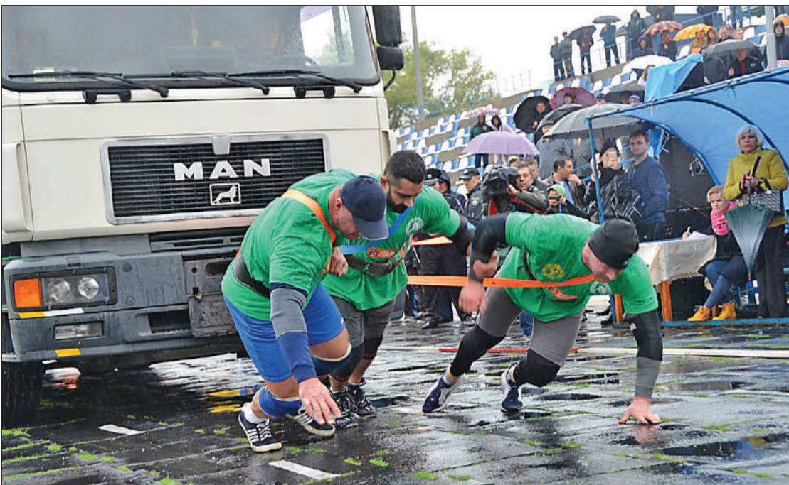
■ Такого Днепрорудное еще не видело